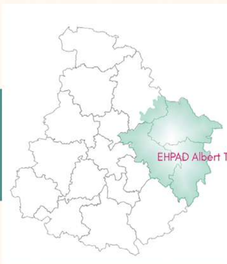
EHPAD Albert TROTTÉ

11 millions d'entre nous accompagne au quotidien un proche en perte d'autonomie.