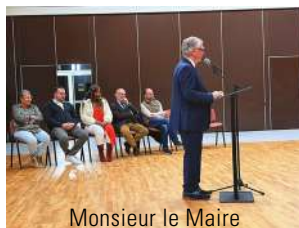
Monsieur le Maire