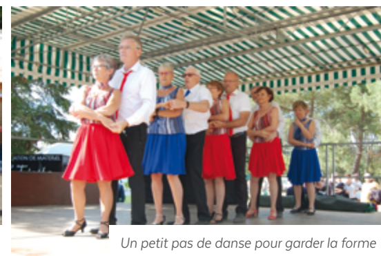
Un petit pas de danse pour garder la forme