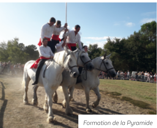
Formation de la Pyramide