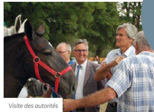
Visite des autorités