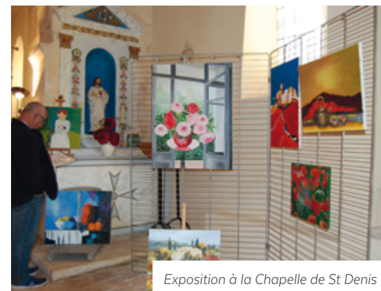
Exposition à la Chapelle de St Denis