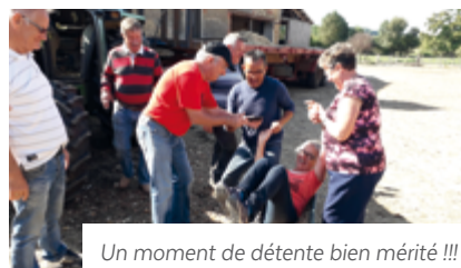
Un moment de détente bien mérité !!!