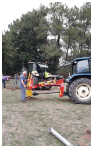
Préparation parcs à animaux