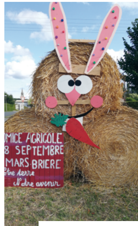
Annnonce du Comice dans St Mars