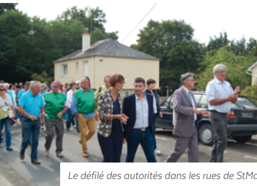
Le défilé des autorités dans les rues de StMars accompagné par la Banda Zankina