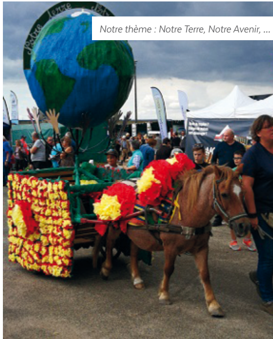
Notre thème : Notre Terre, Notre Avenir, ...