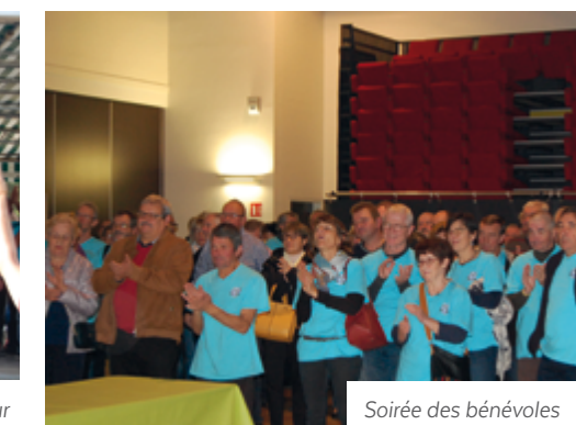
Soirée des bénévoles