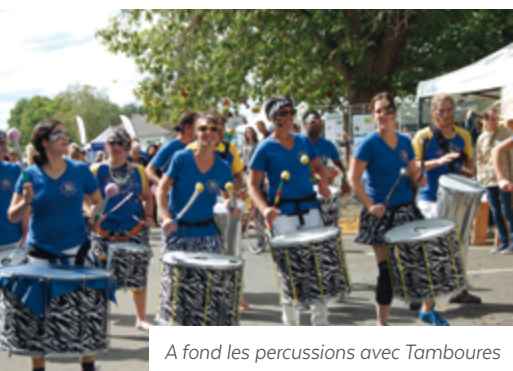
A fond les percussions avec Tamboures