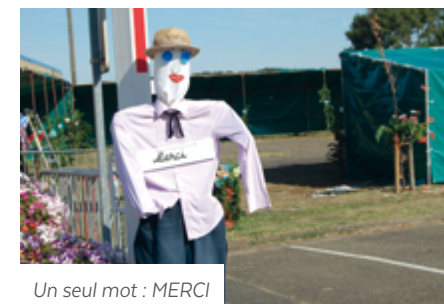
Un seul mot : MERCI