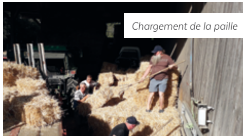
Chargement de la paille