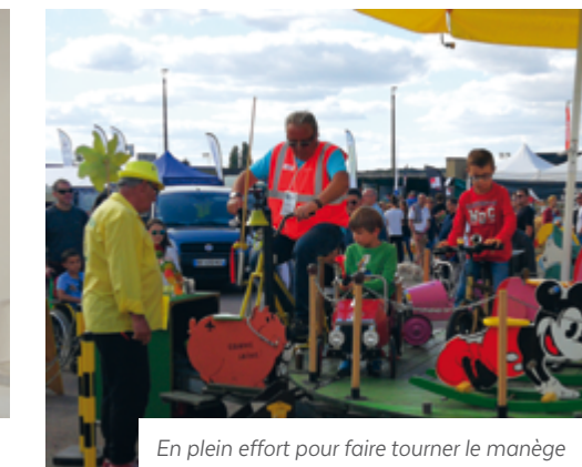
En plein effort pour faire tourner le manège