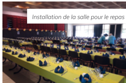
Installation de la salle pour le repas