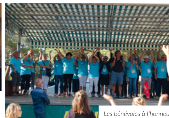
Les bénévoles à l'honneur