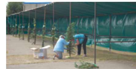
Fabrication et Mise en place des décorations