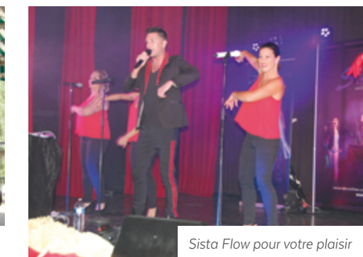
Sista Flow pour votre plaisir