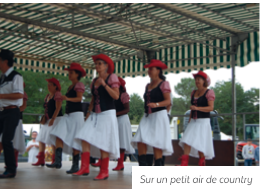
Sur un petit air de country