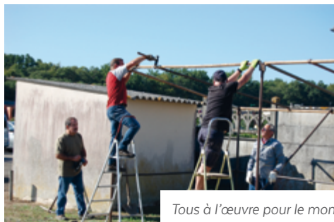
Tous à l'œuvre pour le montage des 150 stands